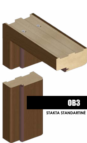
OB3 STAKTA STANDARTINĖ