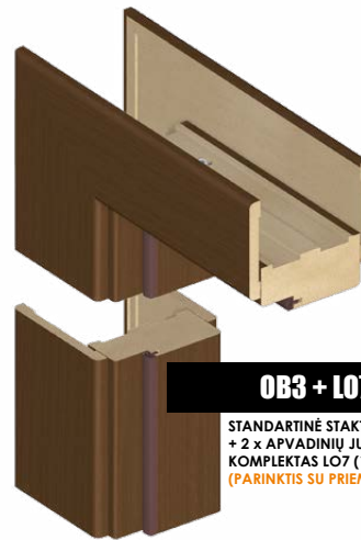
OB3 + LO7 STANDARTINĖ STAKTA + 2 x APVADINIŲ JUOSTŲ KOMPLEKTAS LO7 (16 x 80 MM) (PARINKTIS SU PRIEMOKA)