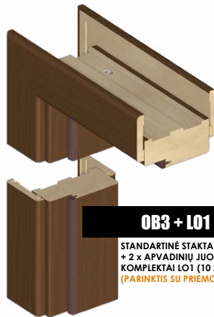
OB3 + LO1 STANDARTINĖ STAKTA + 2 x APVADINIŲ JUOSTŲ KOMPLEKTAI LO1 (10 x 60 MM) (PARINKTIS SU PRIEMOKA)