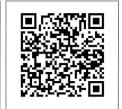
STAKTOS DIAPAZONO KEITIMAS