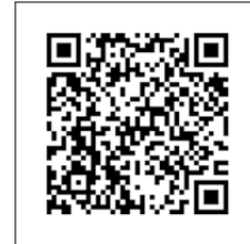
REGULIUOJAMOS STAKTOS MONTAVIMAS

PAŽIŪRĖKITE MŪSŲ VAIZDO ĮRAŠĄ „YOUTUBE“ KANALE (ANGLŲ KALBA):